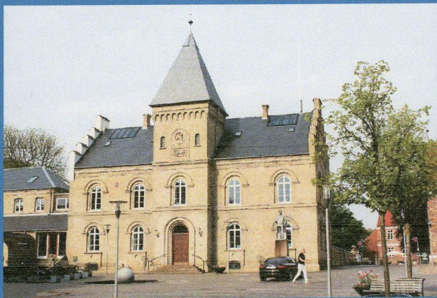
Besøg os på Det Gamle Rådhus på